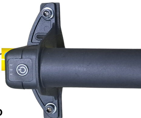
Indicadores de LED