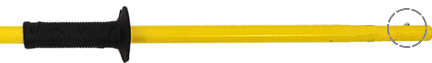
Encaixe das Ponteiras